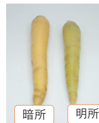
収穫後4日目の青果物